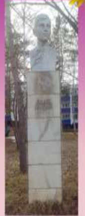
Памятник Валентину Котику близ Тольятти