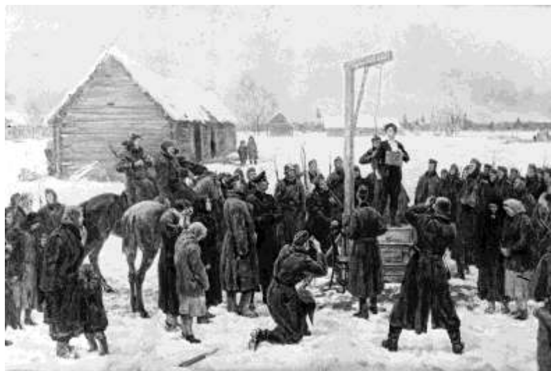
Рис 1: Картина "Таня" Кукрыниксов — М. В. Куприянов, П. Н. Крылов

Утром следующего дня девушку привели на место казни с табличкой на шее. Там была выведена надпись "Поджигательница домов". Но Зоя с достоинством держалась. Она верила в победу советского народа над фашистами и призывала людей не сдаваться. А когда из уст измученной партизанки слетели известные слова: "Граждане! Вы не стойте, не смотрите, а надо помогать воевать! Эта моя смерть — это моё достижение" из под ее ног выбили табуретку.